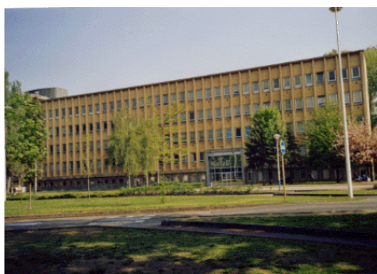
Bâtiment des Sciences

Lieu: IECL, Département de Mathématiques, bâtiment A salle 122